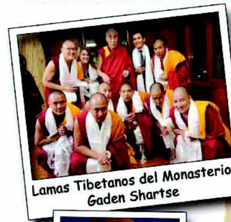
Lamas Tibetanos del Monasterio Gaden Shartse